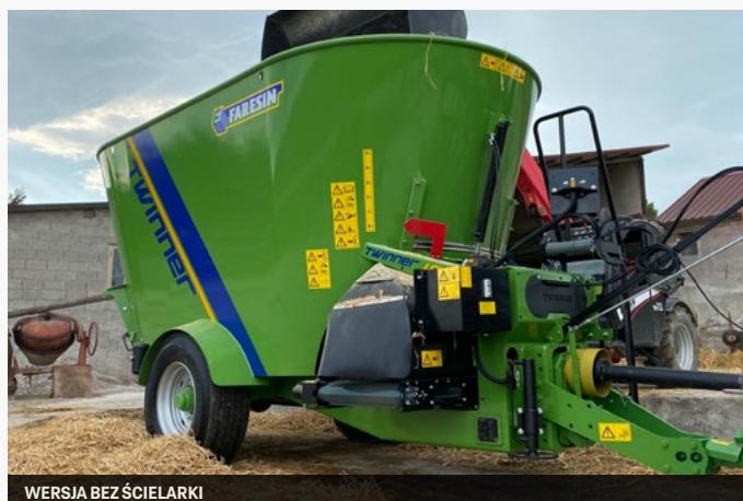
WERSJA BEZ ŚCIELARKI