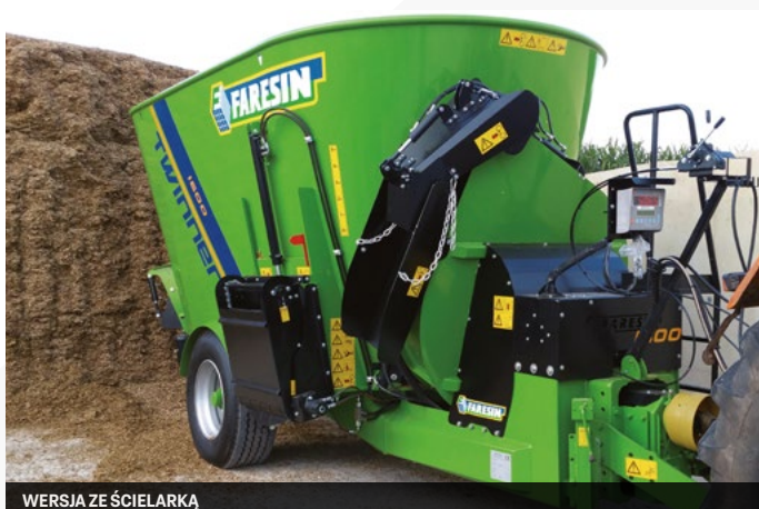
WERSJA ZE ŚCIELARKĄ