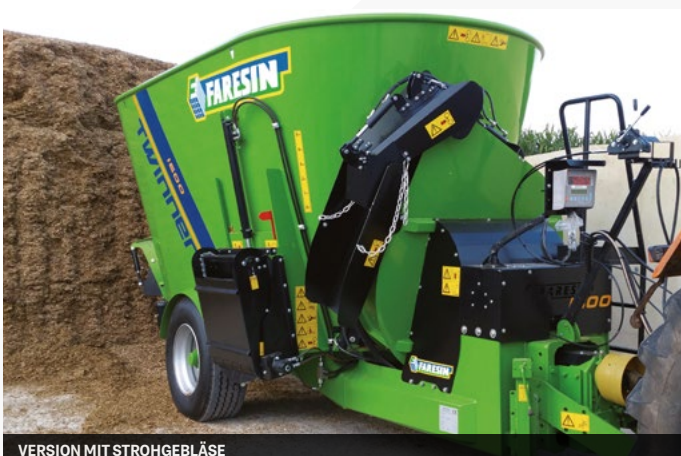
VERSION MIT STROHGEBLÄSE