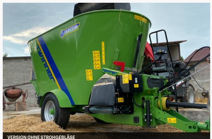
VERSION OHNE STROHGEBLÄSE